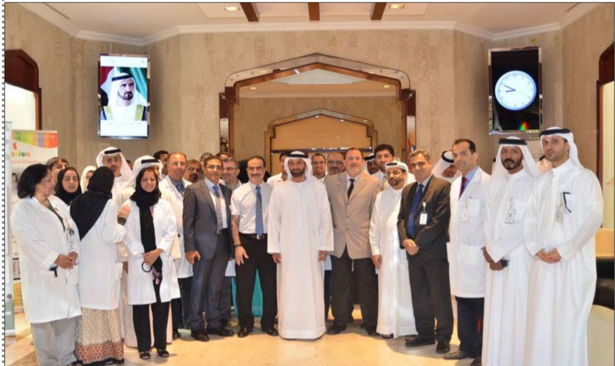
لتحقيق رضا العملاء والتواصل معهم ومطالبا ببنال المزيد من الجهود لتحقيق تطعات الهيئة وبرامجها التطويرية وغرس ثقافة الجودة في العمل لتقديم خدمات متميزة تحافظ على موقع وسعة

والمعاملين من الكادر الطبي والإداري ثم توجه إلى مركز الكرامة للباقة الطبية حيث التقى بعدد كبير من المراجعين الذين تبادلوا معه التهانئ والأحاديث الودية. وفي مستشفى لطيفة كانت محطة الزيارة التالية للميدور حيث استمع خلالها للعديد من الاقتراحات التي تقدم بها العاملون في المستشفى لتطوير الأداء تبعها بزيارة إلى مركز البرشاء التقى خلالها العاملين بالمركز وناقش معهم موضوع تفعيل العمل في المراكز الصحية التابعة للهيئة على مدار الساعة. وفي نهاية الجولة أبدى مدير عام هيئة الصحة بدبي ارتياحه بشكل عام حول مستوى واسلوب وسرعة إجراءات العمل المتبعة على المستوى الإداري والطبي مثنياً الجهود التي يقوم بها الموظفون في مواقع عملهم