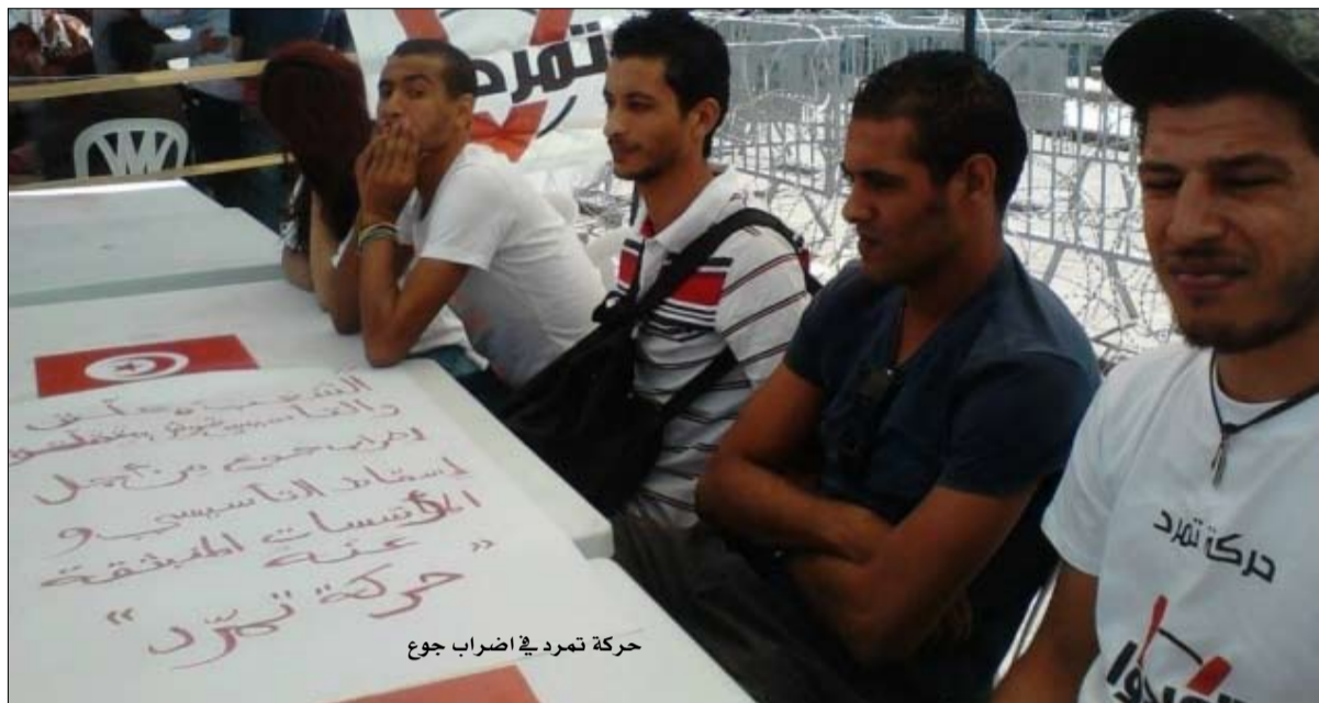
حركة تمرد في اضراب جوع