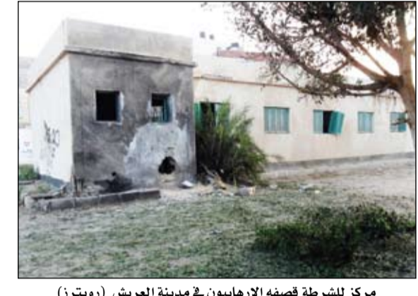
مركز للشرطة قصفه الارهابيون في مدينة العريش

هجوم مباغت للشرطة، في الميدان، الذي يعتصم فيه جماعة الإخوان المسلمين، احتجاجاً على عزل الدكتور محمد مرسى من رئاسة الدولة. هذا ودعا انصار الرئيس الاسلامي محمد مرسى امس الاحد إلى تظاهرات جديدة، بينما تنتهي مهلة حددتها السلطات المصرية التي تستعد لتفريق اعتصامين في ساحتين في القاهرة بالقوة. على صعيد آخر أكد رئيس الوزراء المصري الدكتور حازم الببلاوى دعم حكومته الكامل للقوات المسلحة في حربها ضد الإرهاب وتطهير سيناء من الارهابيين. جاء هذا في الوقت الذي أعلنت فيه القوات المسلحة المصرية، عصر امس أن عناصرها هاجمت بؤرة لجموعة من الإرهابيين بشمال سيناء أسفرت عن سقوط 25 منهم بين قتيل وجريح، كم دمرت مخزناً للأسلحة والذخيرة. وقال الناطق الرسمي باسم القوات المسلحة المصرية العقيد أركان حرب أحمد محمد علي، عبر صفحته الرسمية على موقع التواصل الاجتماعي (فيسبوك)، إن عناصر من القوات المسلحة قامت بتنفيذ عملية نوعية ضد مجموعة إرهابية جنوب قرية التومة في مدينة الشيخ زويد (بشمال صحراء سيناء) ممن تلوثت أيديهم بدماء شهدائنا في الجيش والشرطة بشمال سيناء. وأوضح على أن العملية أسفرت عن سقوط 25 عنصراً إرهابياً بين قتيل وجريح إلى جانب تدمير مخزن للأسلحة والذخيرة والذي تستخدمه هذه العناصر ضد القوات المسلحة والشرطة المدنية وترويع المواطنين الأبرياء في شمال سيناء، مجدداً تعهد القوات المسلحة بملاحقة الإرهابيين والقضاء على البؤر الإجرامية حتى يتم فرض الأمن في شمال سيناء وكافة ربوع مصر.