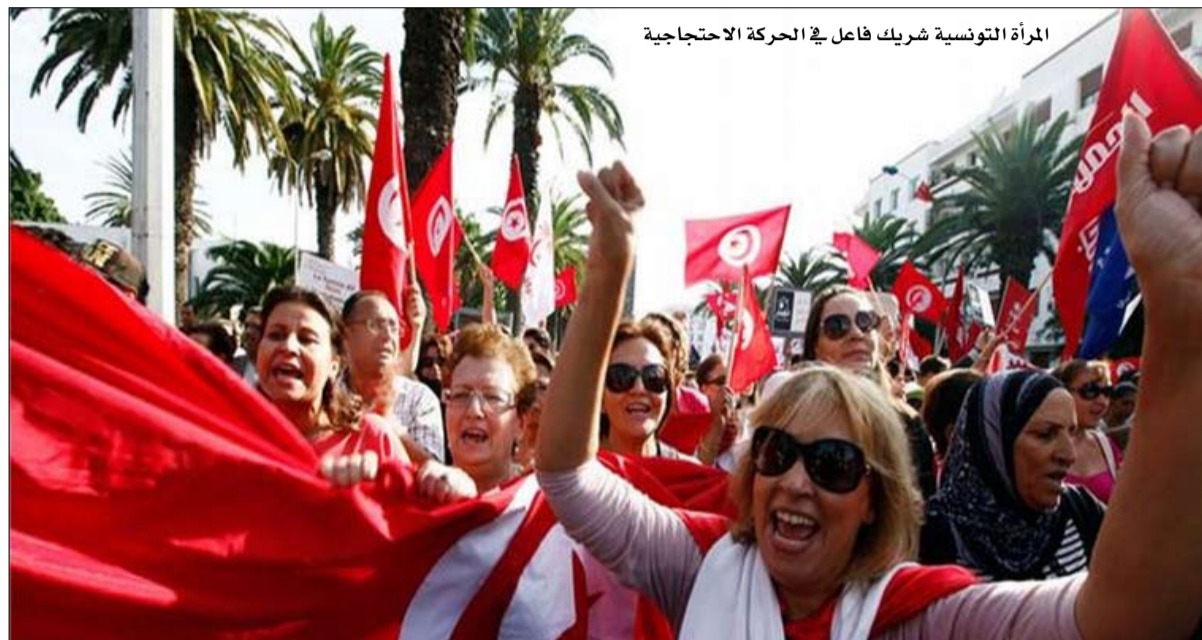
المرأة التونسية شريك فاعل في الحركة الاحتجاجية